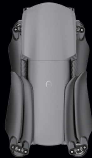
Deep Space Gray